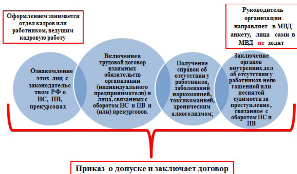
Рисунок 2. Допуск лиц к работе с наркотическими средствами и психотропными веществами

Допуск лиц к работе предусматривает алгоритм, представленный на рисунке 2.