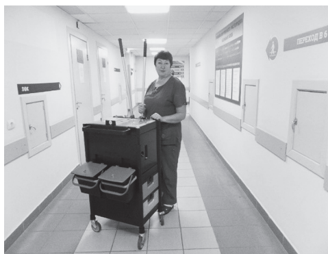
Рис. 3. Укомплектованная уборочная тележка

средствами, мешками для сбора отходов и расходными материалами. Крепят швабры. Тележки мы не маркируем по видам уборочных работ, так как уборщицы не завозят их в помещения. Персонал формирует тележки только для одной категории: палаты, режимные кабинеты.