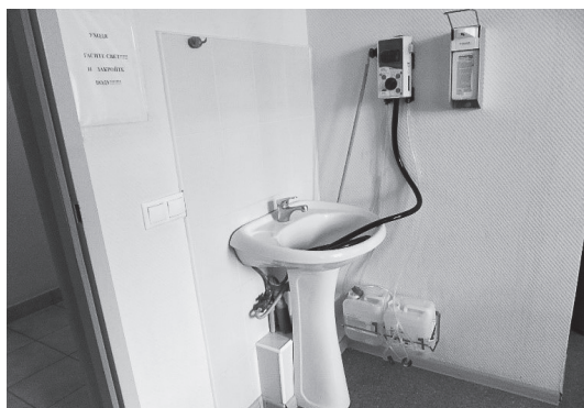
Рис. 2. Дозирующее устройство