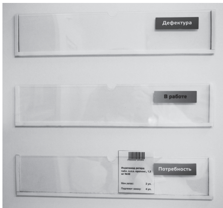
Фото 1. Карточка в кармане «Потребность»