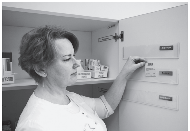
Фото 2. Пример размещения карточки в кармане «В работе»