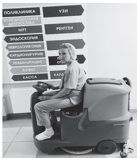
Рис. 1. Уборка с помощью поломоечной машины

корпусах располагаются раздевалки, комната отдыха, постирочные, комната для хранения чистого инвентаря, комната для обработки поломоечной машины. Комнаты подбирали с учетом подвода коммуникаций, меняли электропроводку.