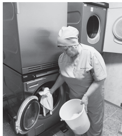
Рис. 5. Персонал закладывает салфетки в стирку

Обеззараженные тележки перемещают в чистую зону. Снова комплектуют чистым увлажненным уборочным материалом и передают уборщицам.