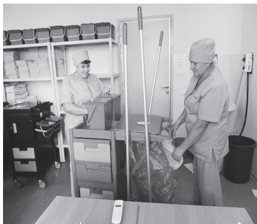
Рис. 4. Персонал разгружает тележки с мопами